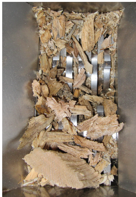
Abb. 2: Schneidwerk