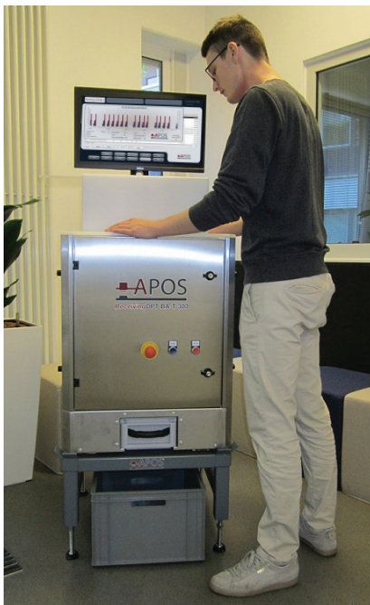
Abb.1: ReceivingOPT BA-T 300

Zusätzlich wird es geliefert mit der vollwertigen Materialannahmesoftware der APOS, so dass es als Abrechnungsinstrument eingesetzt werden kann. Eine Integration in Ihr ERP/SAP ist problemlos möglich.