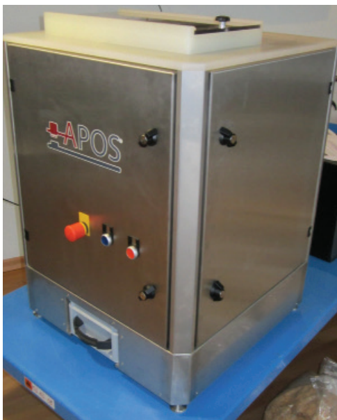
Abb.1: ReceivingOPT BA-T 300

Zusätzlich wird es geliefert mit der vollwertigen Materialannahmesoftware der APOS, so dass es als Abrechnungsinstrument eingesetzt werden kann. Eine Integration in Ihr ERP/SAP ist problemlos möglich.