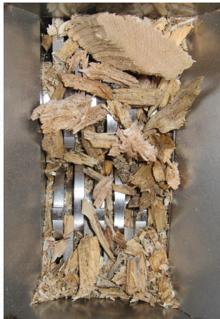
Abb. 2: Schneidwerk